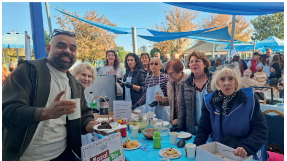
Chaim en Yom Haatzmaut, visitando el stand del Comité de Damas de nuestra Comunidad

Así que mi mensaje es simple, aunque no fácil, que esta cena no sea la excepción, que sea el recordatorio. Que la próxima vez que alguien necesite una mano, no haga falta que la tierra tiemble para que se la tendamos.