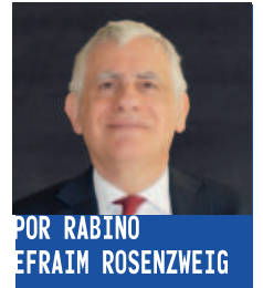
POR RABINO EFRAIM ROSENZWEIG

Uno de los temas de los que nos habla la parashat Nasó en este shabat es el del Nazir, la persona que toma la decisión de abstenerse de comer uvas y de tomar vino, promete no cortarse el pelo y de evitar cualquier contacto con un difunto. (El estado de Nazir tiene validez por treinta días, a menos que se haya especificado un lapso diferente). Nos encontramos, probablemente, con la decisión personal de privarse de algunos de los placeres de este mundo porque se considera que éstos conducen a comportamientos indeseables. En efecto, dado que un capítulo anterior se refiere el proceso de investigación de una mujer cuyo esposo sospecha que comete adulterio, nuestros Jajamim concluyen que la ley del Nazir es mencionada de inmediato, porque el abuso del vino también puede traer como consecuencia la licencia sexual.