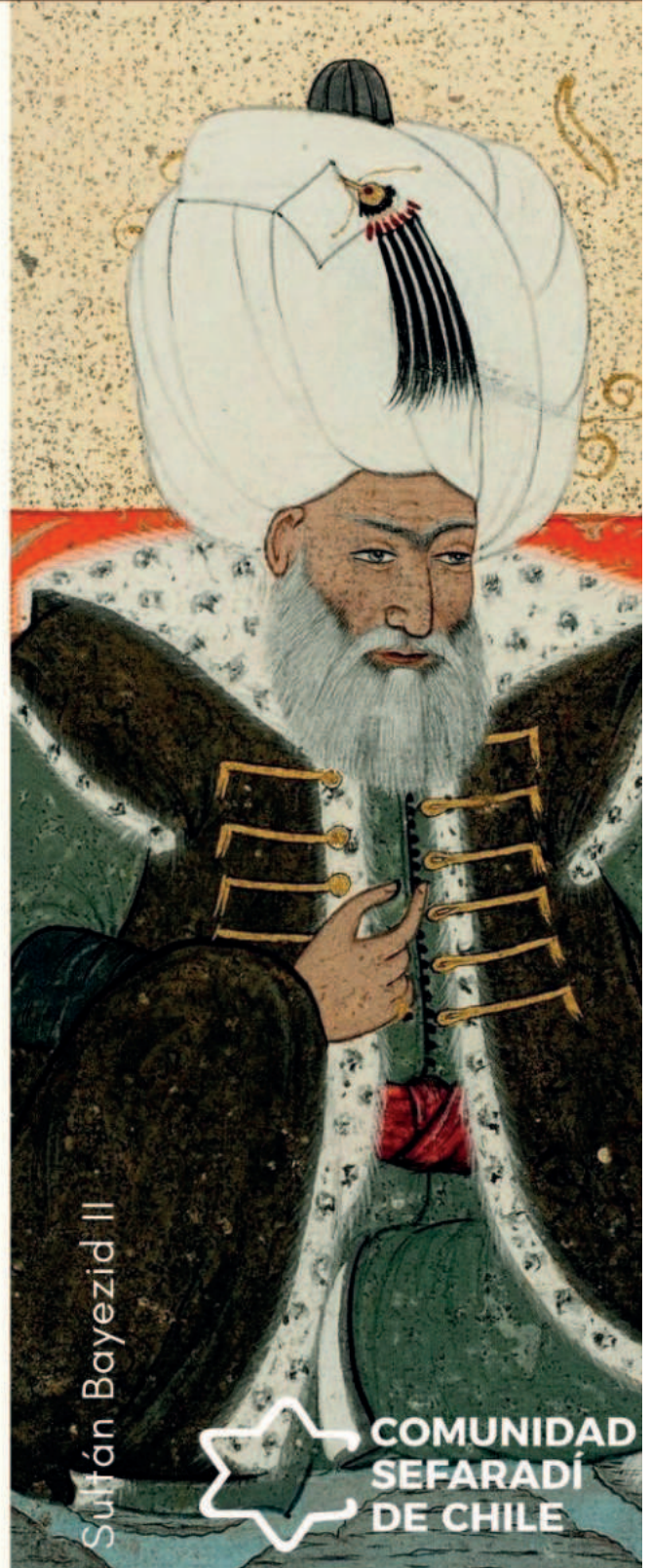
Sultán Bayezid II