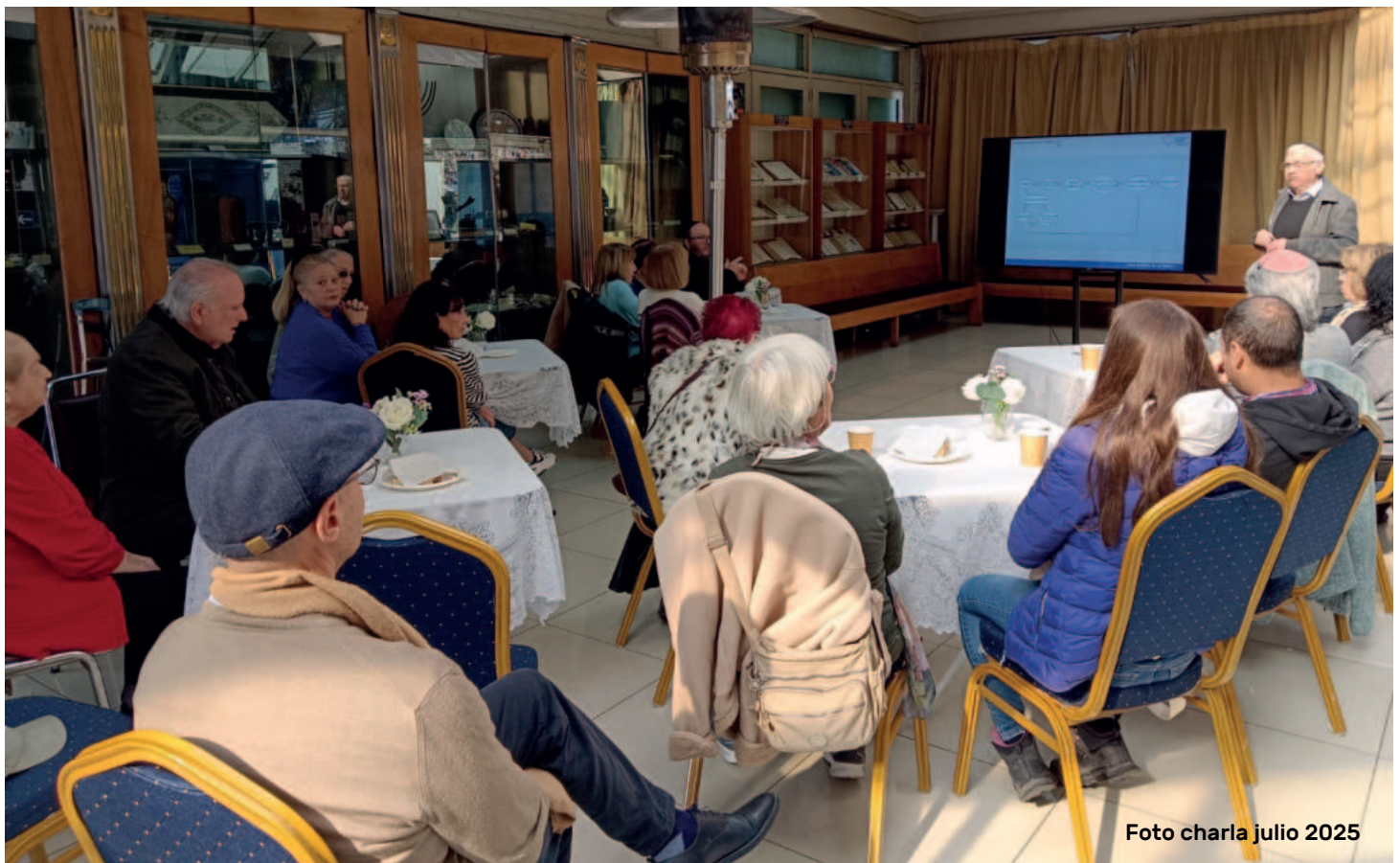
Foto charla julio 2025

Con esta enriquecedora sesión, el ciclo de Desayunos de Rosh Jodesh concluye su año, dejando a los participantes con nuevas herramientas para pensar, cuestionar y crecer. ¡Esperamos con entusiasmo el próximo ciclo 2026!