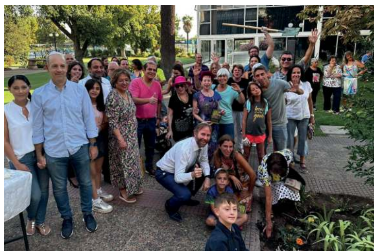
Tu Bishvat 2023

Los esperamos hoy a las 18:20 hrs; tenemos para ustedes árboles frutales y hermosas plantas que se integrarán a nuestro jardín, el que cada año en esta festividad se llena de color y vida.