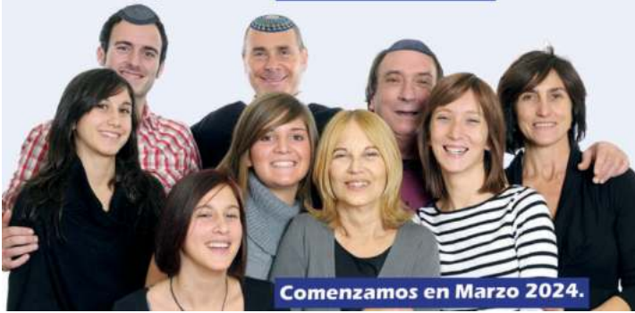
Comenzamos en Marzo 2024.

➔ Para más información contáctate con Deby Grosz al: +56 9 5850 4541