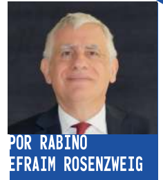
POR RABINO EFRAIM ROSENZWEIG

L os diferentes Korbanot –sacrificios– son el tema de estos capítulos de la parashat Tzav. Estas ofrendas requerían la utilización del fuego tanto en el Mishkán como siglos más tarde en el Beit HaMikdash donde había tres fuentes para este propósito. Mokdá o Maarajá Guedolá era la fogata principal. La segunda fogata, Maarajá Shenyá consistía en carbones utilizados para el ofrecimiento del incienso de la mañana y tarde. Una fogata adicional, Maarajá Lekiyum Haesh, era utilizada en el caso que se extinguiera una de las otras dos.