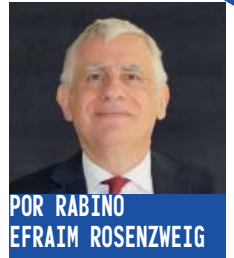
POR RABINO EFRAIM ROSENZWEIG

I aacov tiene que abandonar el hogar paterno porque Esav decide matarlo al enterarse de que su hermano lo había despojado de su primogenitura. Rivká, al conocer las intenciones de Esav, insta a Iaacov a ir a Jarán a la casa de su hermano Labán. Dice la Torá: “vayifgá baMakom”, y se encontró en el lugar. Lugar en el cual se recostó de una piedra, vayajalom “y soñó”. Para nuestros jajamim, Makom, lugar, es también una manera de referirse a D’os, porque El, le da cabida a todo. D’os es el “lugar por excelencia”, porque sin El no hay existencia. Señalan, igualmente, que la palabra vayifgá también puede interpretarse en el sentido de oración, o sea que vayifgá baMakom, implica que Iaacov oró a D’os. Nuestros jajamim opinaban que la Torá no había sido otorgada en el vacío. Con anterioridad a la revelación en el Monte Sinaí, existieron personas excepcionales que guiaron sus vidas de acuerdo con muchos de los principios enumerados posteriormente en la Torá. Sugieren, por ejemplo, que los patriarcas cumplieron con todos estos preceptos que fueron enunciados siglos más tarde, gracias a su sensibilidad profética.