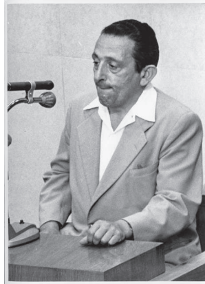
Dando testimonio en el juicio de Eichmann, 1961