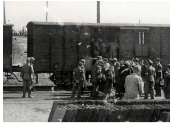
Deportación por tren de los judíos del gueto de Lodz, Polonia, agosto de 1944