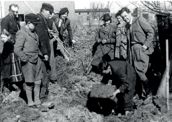
Henryk Ross con una caja de negativos que fotografió en el gueto de Lodz, Polonia, marzo de 1945

Sus imágenes -no oficiales- cubrían escenas de la vida cotidiana, celebraciones comunales, niños que buscaban restos de comida y grandes grupos de judíos que eran deportados y cargados en furgones. Mientras el gueto se liquidaba en el otoño de 1944, Ross enterró sus fotos y negativos en una caja, con la esperanza que pudieran sobrevivir como un registro histórico. Pudo desenterrar la caja en enero de 1945, después que el ejército rojo liberó a Polonia. Gran parte de su material fue dañado o destruido por el agua; aun así, aproximadamente la mitad de sus 6 mil imágenes sobrevivieron. Ross testificó más tarde durante el juicio de 1961 de Adolf Eichmann.